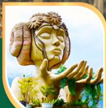
โมนาน้ำชาปาคาเฟ้