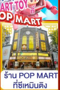
ร้าน POP MART ที่ซีเหมินติง