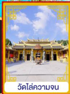
วัดไล่ความจน