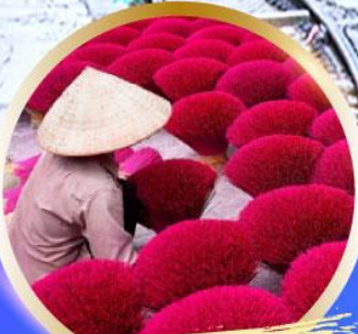
หมู่บ้านรูป Phu Cau