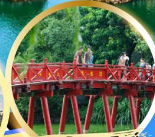
สะพานแสงอาทิตย์