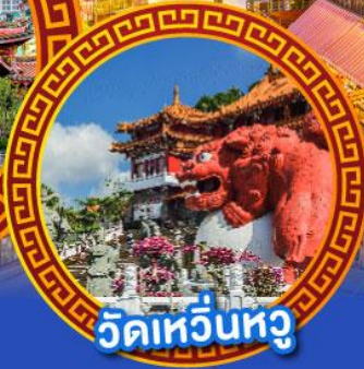
วัดเหว่หนู่