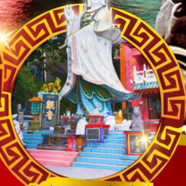
เจ้าแม่กวนอิม หาดศรีพัลลภ