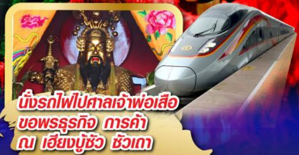
นั่งรถไฟไปศาลเจ้าพ่อเสือ ขอพรธุรกิจ การค้า ณ เชียงมู๊ซิว ชิวเถา