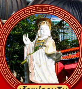
เจ้าแม่กวนอิม รพีลาสีย์