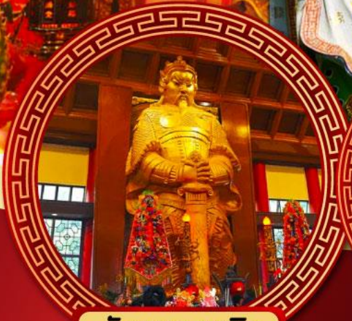
วัดเขangkหมิว