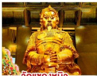
วัดแซงทมิว