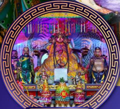
ศาลเจ้าหังเจีย