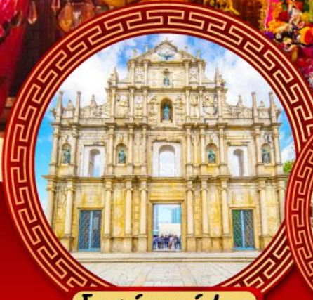
โบสถ์เซนต์ปอล