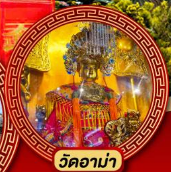
วัดอาม่า