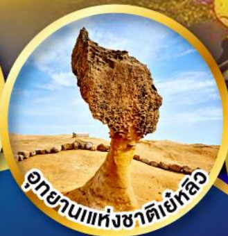
อุทยานแห่งชาติเย่หลิว