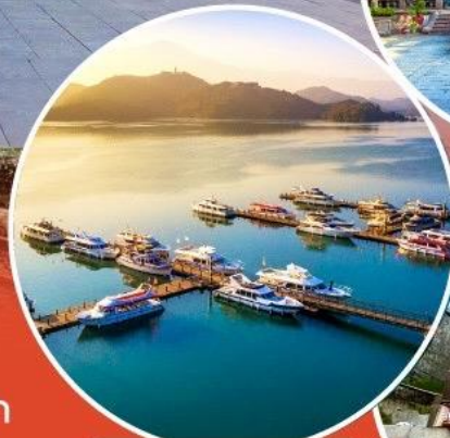
ทะเลสาบสุริยขึ้นจันทรา