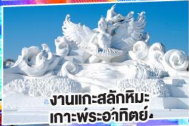
งานแกะสลักหิมะ เกาะพระอาทิตย์