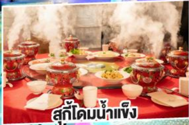
สุกี้ไคมน้ำแข็ง