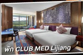
พัก CLUB MED Lijiang