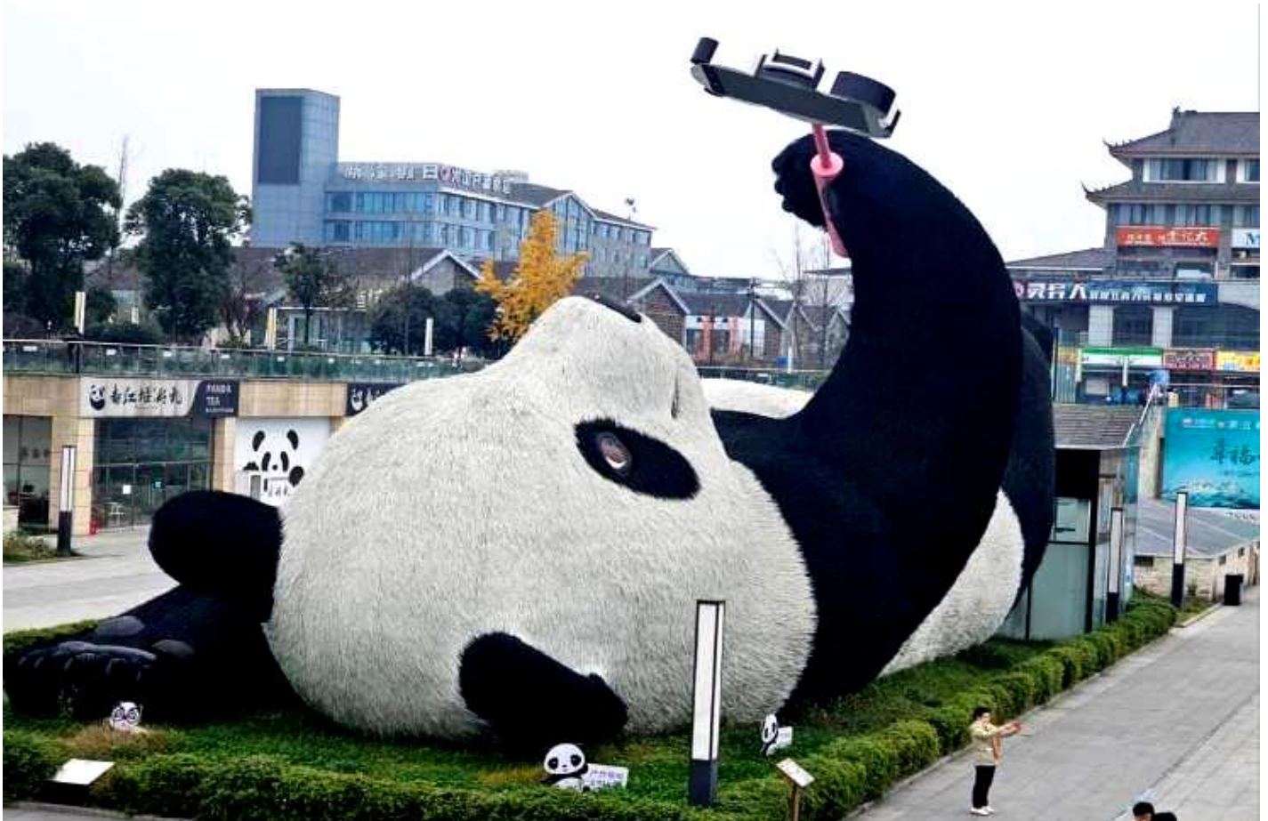
SBTTFU-SL003 เฉิงตู จิวจ้ายโกว โหมวหนี่โกว ภูเขาสี่ตรุณี (นั่งรถไฟความเร็วสูง) 6วัน 5คืน โดยสายการบิน Lion Air (SL)

จากนั้นนำท่านถ่ายกับรูปปั้นผลงานศิลปะ รูปแพนด้าถ่ายเซลฟี่ ที่ตั้งอยู่กลางจัตุรัสสุดน่ารัก ซึ่ง ออกแบบโดยนักออกแบบชื่อดัง Florentijn Hofman หมีแพนด้าตัวนี้มีความยาว 26 เมตร กว้าง 11 เมตร สูง 12 เมตรและหนัก 130 ตัน อยู่ในท่านอนหงายอยู่บนพื้น เท้ายกขึ้นจับไม้เซลฟี่สีชมพู เล่น ถ่ายเซลฟี่อย่างสบายอารมณ์ น่ารักน่าเอ็นดูมาก นักออกแบบ Hofman แนะนำว่าผลงานแพนด้ายักษ์ โทรศัพท์มือถือขึ้นเพื่อถ่ายเซลฟี่มีความสุขมาก ด้วยท่าทางสบายๆ ผ่อนคลายและมีความสุข และ เป็นการแสดงออกด้วยภาษาทางศิลปะแบบหนึ่งที่สะท้อนชีวิตในท้องถิ่น มอบความรู้สึกสนิทสนมและ มีความสุขกับผู้ชมทุกท่าน